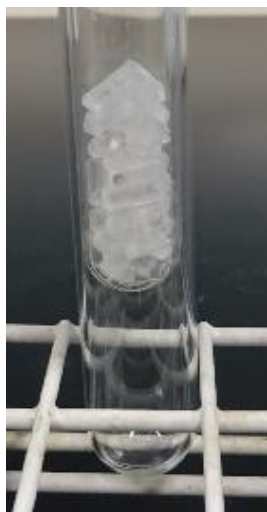
図3 試験管を二重にして温度の急変を防ぐ

チオ硫酸ナトリウム(商品名「ハイポ」。融点 48^{\circ}\text{C} ) を利用する。二重にした試験管内に入れたチオ硫酸ナトリウムを、熱湯で湯煎しながら状態(固体か液体か)と温度変化を記録する。