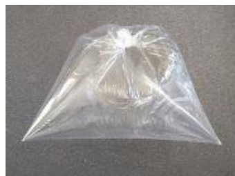
図1 エタノールを入れた袋 (上：加熱前、下：加熱後)